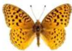
1 - AFRODITA Speyeria aphrodite (Mexique) Aphrodite Auto valorisation – Communication - Beauté

Un élixir pour augmenter le charisme. Il nous permet de découvrir, d'apprécier, d'augmenter la beauté tant intérieure qu'extérieure. Pour profiter de notre capacité d'attraction envers les autres, mais d'une façon positive et constructive. ( Rudbeckia )