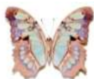
7 - CAPUCCINO Siproeta stelenes (Pérou) Malachite Force - Objectifs

Cet élixir est un catalyseur de transformation, qui permet de faire l'expérience des rites de l'initiation spirituelle. Il favorisera ainsi l'émergence de nos capacités de leader ou de guérisseur. Il est spécialement recommandé lorsque ce processus se prolonge pendant trop longtemps et/ou est douloureux. ( Canne à sucre / Bourg. de marronnier )