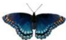
4 - ARTEMIS MANCHADO Limenitis arthemis astyanax (Canada) Amiral Manifestatio

Cet élixir renforce les aspects agréables et le plaisir de l'amour physique, en augmentant l'énergie sexuelle. Cela permet d'expérimenter l'acte de l'amour comme étant une célébration totale de la création de l'univers. ( Palo boracho / Ave del Paraiso )