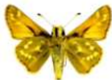
5 - CAPITAN SALPICADO DE PLATA Hesperia comma (Canada) Virgule Jouissance et foi en la vie

Cet élixir relie le chakra racine avec le chakra de la couronne, ouvrant ainsi les portes vers le 8 ème , 9 ème et 10 ème chakra. Il permet la MANIFESTATION. De plus, il nous apporte protection contre la négativité de par l'élévation de notre niveau de vibration.