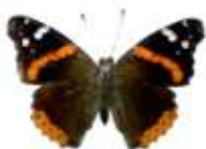
2 - ALMIRANTE ROJO Vanessa atalanta (Guatemala) Vulcain Autorité – Fermeté

Un élixir pour augmenter le charisme. Il nous permet de découvrir, d'apprécier, d'augmenter la beauté tant intérieure qu'extérieure. Pour profiter de notre capacité d'attraction envers les autres, mais d'une façon positive et constructive. ( Rudbeckia )