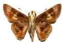
6 - CAPITAN VIOLETA Nyctelius nyctelius (Argentine) Euripus Eveil spirituel – Initiation

Cet élixir nous donne la foi en l'avenir avec la reconnaissance de l'aspect positif qui nous attend. Afin de nous aider à avoir des rêves heureux et joyeux, pour élaborer de bons projets, trouver le temps et l'énergie pour jouer et profiter pleinement de la vie. Il sera utile dans les situations de cauchemars nocturnes, spécialement chez les enfants. ( Vipérine commune )